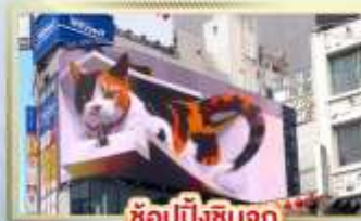
ซูปป์ิงชินจูกุ