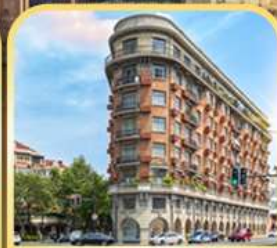
อาคารอู่คัง