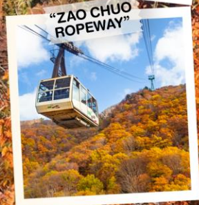
"ZAO CHUO ROPEWAY"

วันเดินทาง 30 ต.ค. - 5 พ.ย. 2569 4 - 10 พ.ย. 2569