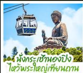
เน็กระเซ้าเองปิง ไฮวีพระใหญ่เทียนถาน