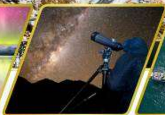
กิจกรรมชมทิวทัศน์ดาว