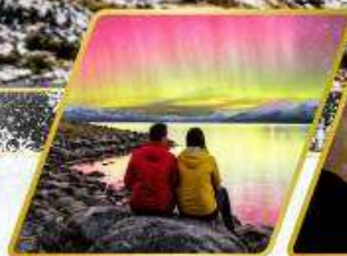
ตามล่าหาแสงใต้