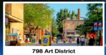
798 Art District