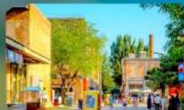
798 Art District