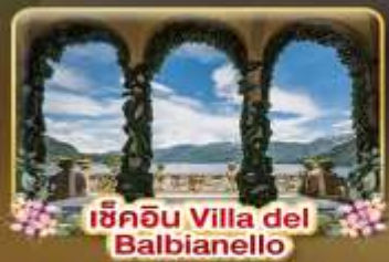
เชคอิน Villa del Balbianello

ที่สุดของธรรมชาติแห่งอิตาลี ทิวเขา ทะเลสาบ ความงามแห่งโคโลโม