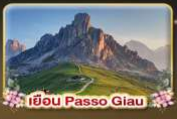
เยือน Passo Giau