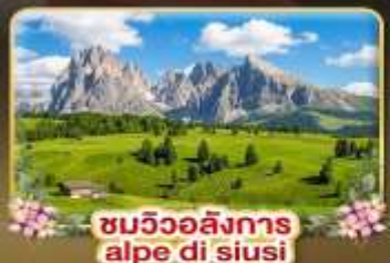
ชมวิวอลังการ alpe di siusi