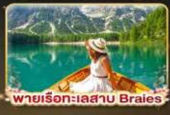
พายเรือทะเลสาบ Braies