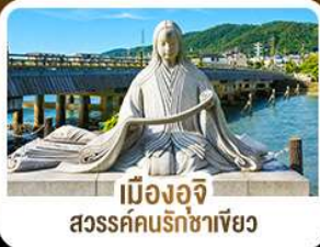
เมืองอจิจิ สวรรค์คนรักชาเขียว