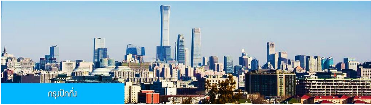
กรุงปักกิ่ง