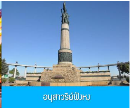
อนุสาวรีย์พิงหว