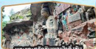
พระแกะสลักหินงาป่าตึงซัน