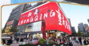
ถนนคนเดินกวนอันเฉียว