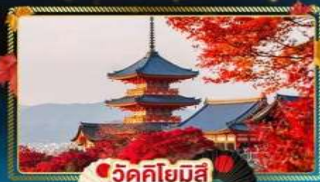
วัดคิโยมิตสึ