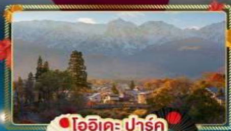
โออิเคะ ปาร์ค