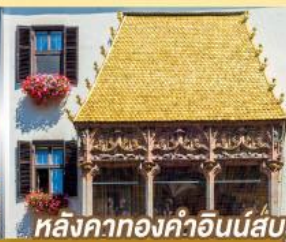
หลังคาทองคำอินน์ส์บรุค