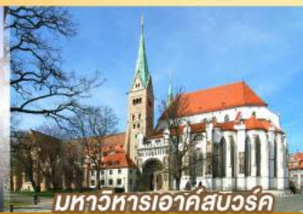
มหาวิหารเอาก์สบูร์ค