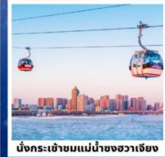
นั่งกระเช้าชมแม่น้ำซงฮวาเจียง