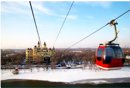
นั่งกระเช้าชมแม่น้ำซวงวาเจียง

พักที่ VIENNA INTER HOTEL โรงแรมระดับ 4 ดาวท้องถิ่น ในเมืองเมืองซ่งจี้