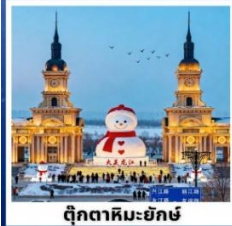
ตึกคาทอลิก