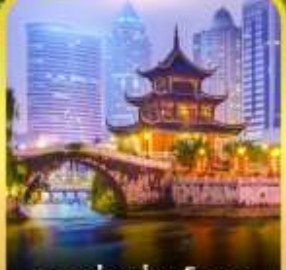
หอเจียเซียงโกลว