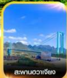
สะพานฮวาเจียง