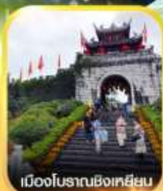
เมืองโบราณชิงเหมียน