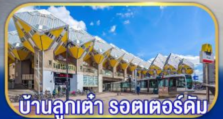
บ้านลูกเต่า รถเตอร์ดัม

เยือนเมืองเก่าแก่ยุโรป ทั่วมหาทวีปยุโรป กับการบินไทย บินตรงอัมสเตอร์ดัม