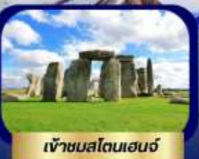
เข้าชมสโตนเฮนจ์