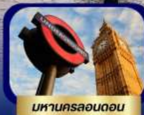
มหานครลอนดอน