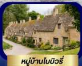
หมู่บ้านไบบิวรี่