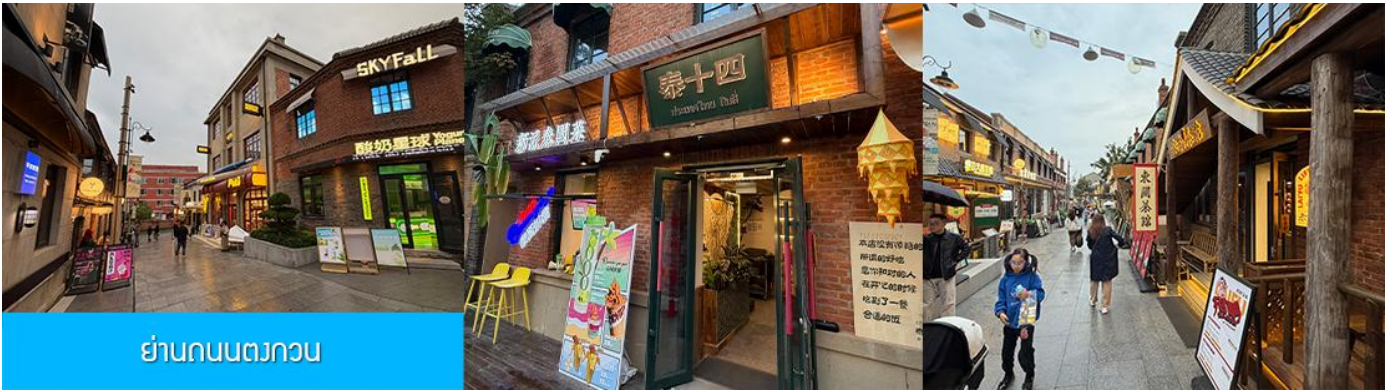
ย่านถนนตวงวน