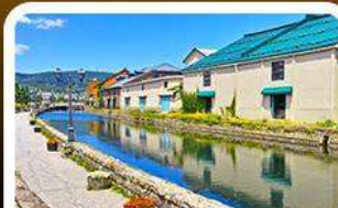
คลองไอตารุ