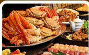
บุฟเฟ่ต์ซาซิมิ+ชาบู 3 ชนิด