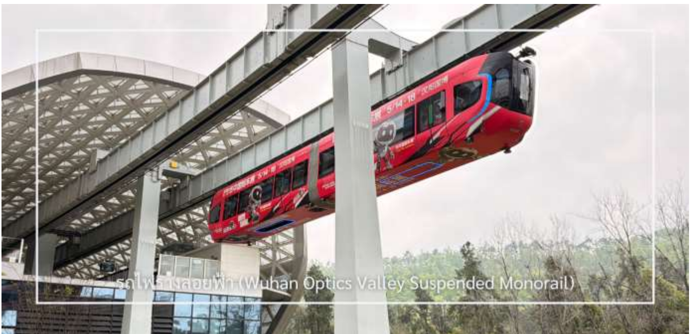
รถไฟรางลอยฟ้า (Wuhan Optics Valley Suspended Monorail)

หลังอาหารเช้า นำท่านสัมผัสประสบการณ์ราวกับอยู่ในโลกอนาคต กับการ นั่งรถไฟรางลอยฟ้า (Wuhan Optics Valley Suspended Monorail) (จำนวน 2 สถานี) ในเมือง Wuhan ระบบขนส่งสมัยใหม่ที่โดดเด่นด้วยการวิ่งขบวนไต่ราง ให้ความรู้สึกแปลกใหม่ ตื่นตาตื่นใจ พร้อมชมวิวเมืองในมุมมองที่แตกต่างอย่างน่าประทับใจ