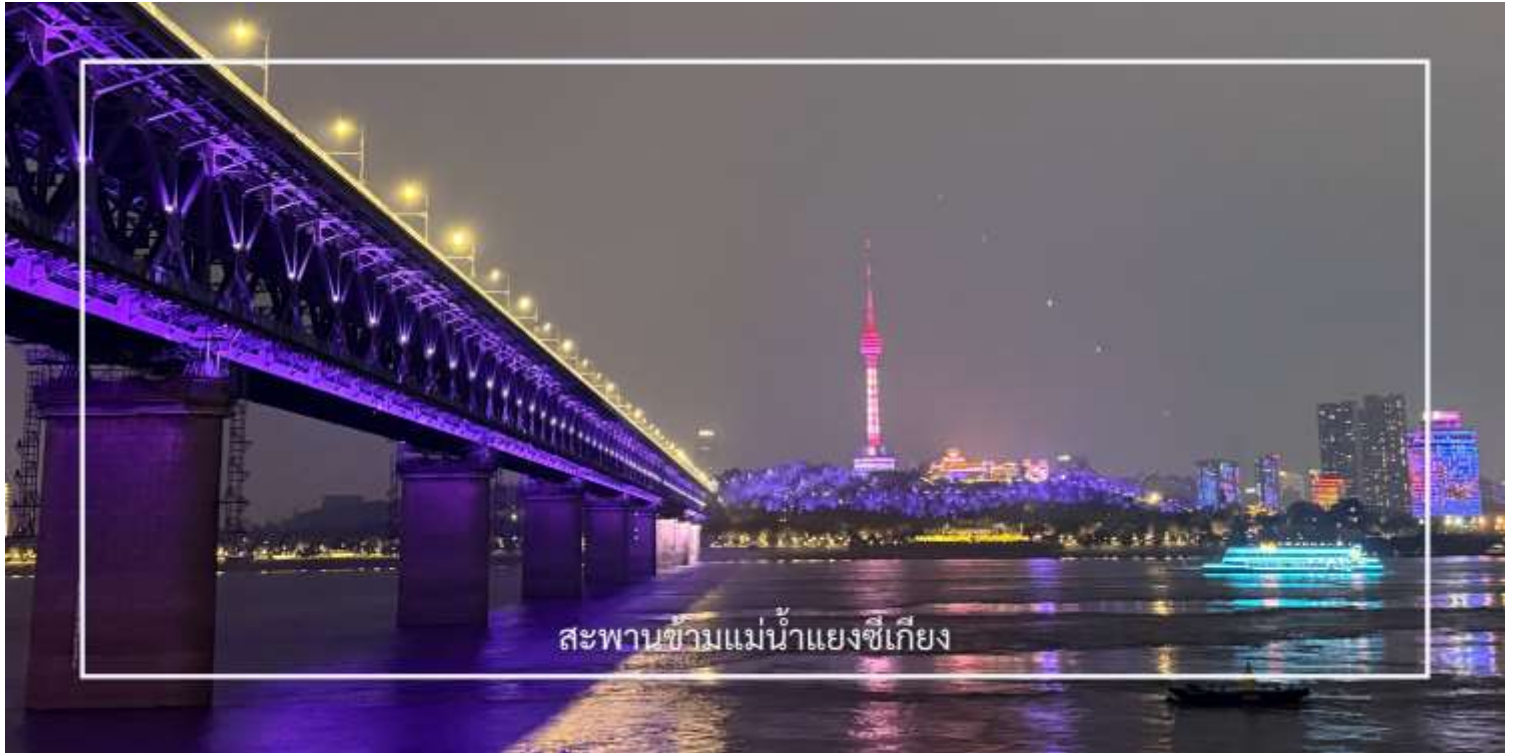
สะพานข้ามแม่น้ำแยงซีเกียง

นำท่านชม สะพานข้ามแม่น้ำแยงซีเกียงแห่งแรกของประเทศจีน (Wuhan Yangtze River Bridge) สะพานสำคัญที่เชื่อมระหว่างฝั่งฮั่นโข่วและอู่ชาง สร้างขึ้นในปี ค.ศ. 1957 และถือเป็นหนึ่งในสัญลักษณ์ของการพัฒนาโครงสร้างพื้นฐานของจีนในยุคใหม่ ตัวสะพานเป็นโครงสร้าง 2 ชั้น สำหรับการสัญจรของรถยนต์และรถไฟ บริเวณนี้ยังเป็นจุดชมวิวที่สามารถมองเห็นแม่น้ำแยงซีเกียงและทัศนียภาพของเมืองอู่ฮั่นได้อย่างสวยงาม โดยเฉพาะในช่วงค่ำคืนที่แสงไฟของเมืองส่องสะท้อนกับสายน้ำ สร้างบรรยากาศที่น่าประทับใจ