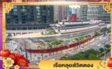
เรือลู่สวีตคอง