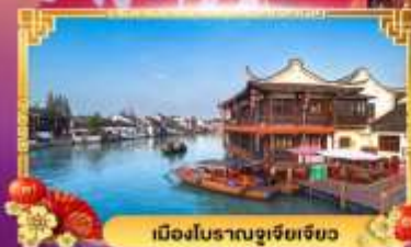
เมืองโบราณซูเจียเจียว