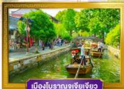
เมืองโบราณซูโจว