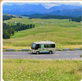
ทุ่งหญ้าเจียนปูลาเค่อ