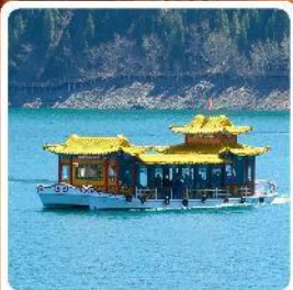
ล่องเรือทะเลสาบเทียนจื่อ

ไฮไลท์! ทุ่งหญ้าเจียนปูลาเค่อ เทือกเขาเทียนชาน ล่องเรือทะเลสาบเทียนจื่อ ตลาดต้าปาจา