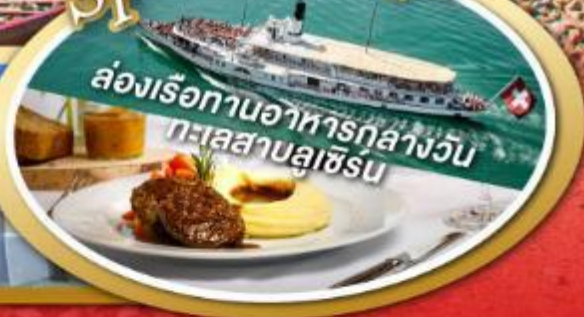
ล่องเรือทานอาหารกลางวัน ทะเลสาบลูเซิร์น