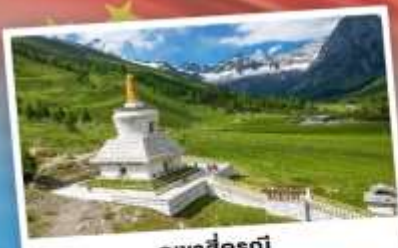
กุ๋เจาสีดรุณี

เที่ยว 2 อุทยาน กุ๋เจาสีดรุณี & ปี้เฉิงโกว เดินชมหิมะแพนด้าสุดน่ารัก ใกล้ชิดกับแพนด้าแดง