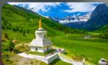
กุเวาสีครุณี