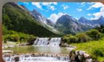
ปี้ฝิงโกว