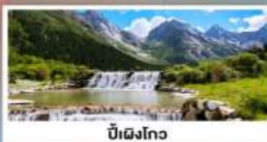
ปี้เฉิงโกว