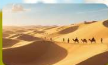
เนินทรายอินเคินทาลา