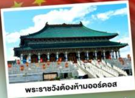
พระราชวังต้องห้ามออร์ดอส

ตะลุยเป็นทรายเป็นร้อยเพลง แห่งมองโกเลียใน ชมวิวทุ่งหญ้าโล่งกว้างตัดขอบฟ้าคราม