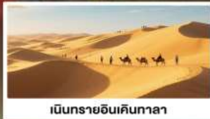
เมืองทรายอินเคินทาลา