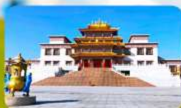
คฤหาสน์พุทธบูชาแห่งชีวิคดูลาน