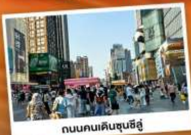
ถนนคนเดินชุนชี่ฮู๋