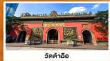
วัดต้าฉีอู๋