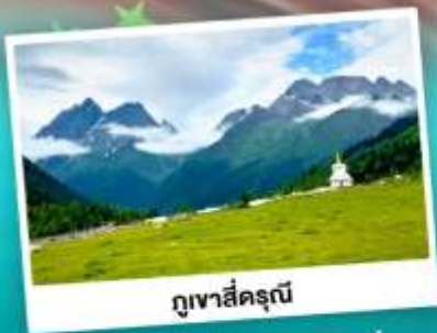
ภูเขาสิครณี

ชมความสวยงามทึ่งหน้าตาทง เกี่ยวภูเขาสิครณี อุทยานยาดิง "แซงกรีท้าวแห่งสุดท่าง" S-คตบ 5A