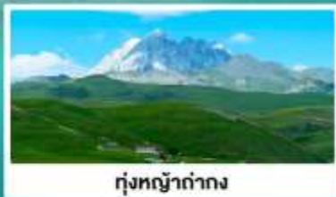
ท่งหน้าตาท่าง