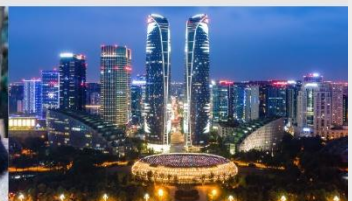
ตึกแฝดเจียงตู

*ทางบริษัทฯ ขอสงวนสิทธิ์ในการสลับโปรแกรมทัวร์ตามความเหมาะสมขึ้นอยู่กับสถานการณ์หน้างาน โดยคำนึงถึงผลประโยชน์ของลูกค้าเป็นสำคัญ