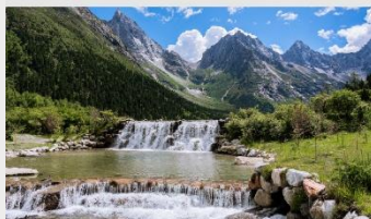
อุทยานแห่งชาติปี่เฟิงโกว