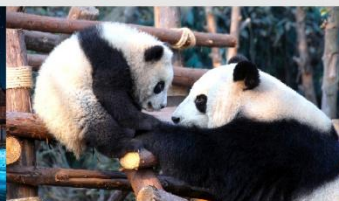
หุบเขาแพนด้าตูเจียงเอี้ยน