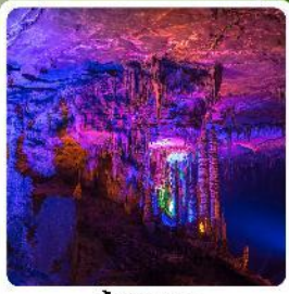
ดำเก้าทพ