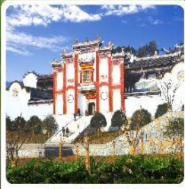
บ้านเกิดชวีหยวน