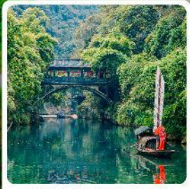
หมู่บ้านซานเสี่ยเหรินเจีย