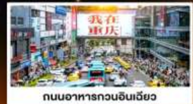
ถนนอาหารถวอนอันเจียว