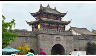
เมืองโบราณทวนช่ียน

ภูเขาสี่ดรุณี - อุทยานบ่ิฝิ่งโกว - สะพานหนานเฉียว - ร้านหนังสือจงซูเก้อ - เมืองโบราณกวนเสียน จตุรัสเทียนหู่ - หมู่บ้านต้าซาฟี่ - ถนนโบราณชอยกว้างชอยแคบ - ถนนคนเดินไท่กู๋หลี่ ถนนคนเดินซุนซี - ถนนโบราณจั้นหลี่ - พิพิธภัณฑ์ปักกิ่ง - น้ำพุไม้ไผ่ตึกSKP - วัดต้าฉือ