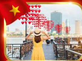
เช็กอินสะพานแห่งความรัก