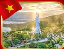
ขอพรกวณอิม วัดหลินอึ้ง