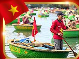
เรือกระด้ง หมู่บ้านกิมทาน