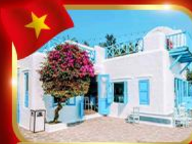
คาเฟ่สุดชิค ซานทรา มาริน่า