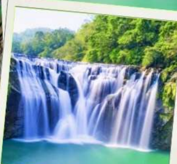
น้ำตกสีส้ม