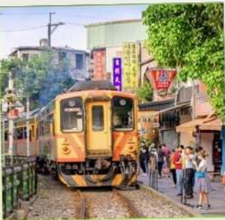
สถานีรถไฟสีส้ม