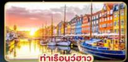
ท่าเรือบูฮาว