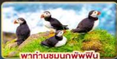
พาท่านชมนกพัฟฟิน