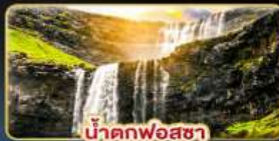
น้ำตกฟอสซา