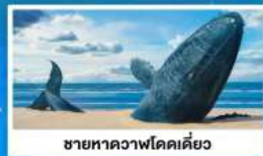
ชายหาดวาฬโดคเค็ย