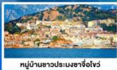
หมู่บ้านชาวประมงซาโจว