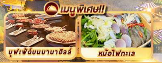
บุฟเฟ่ต์บนบานาฮิลล์