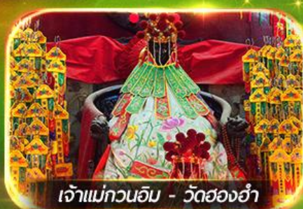
เจ้าแม่กวนอิม - วัดย่องฮำ