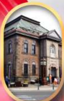
พิพิธภัณฑ์กล่องดนตรี