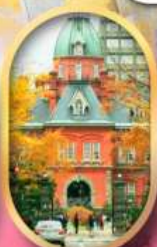
ศาลาว่าการเก่า