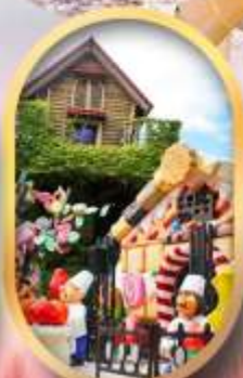
โรงงานช็อกโกแลต