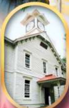
ผ่านชมหอนาฬิกา