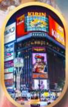
ช้อปปิ้งย่านซุกุโนะ