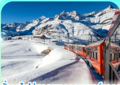
นั่งรถไฟสู่อยอดเขากรอนเนอร์เกรต