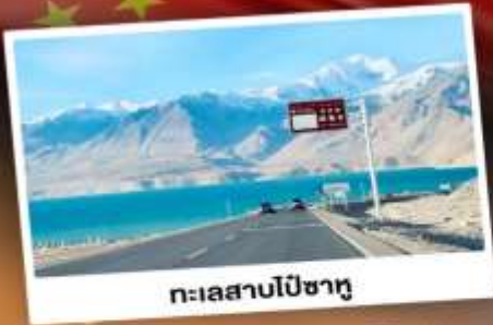
ทะเลสาบเปีซาตู

“ซินเจียงใต้” ดินแดนแห่งทะเลทราย สัมผัสวัฒนธรรมของชาวซินเจียงอุยกูร์