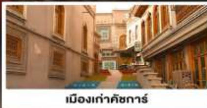
เมืองเก่าคัชการ์