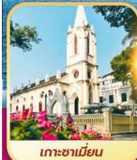
เกาซาเมียน