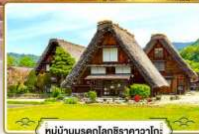
หมู่บ้านมรดกโลกชิราคาวาโกะ

✓ ช้อปบิงย่านฮิตที่สุดในโอซาก้า "ชินโซบาชิ"