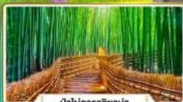
ป่าไม้อาราชิม่า

เที่ยวโตชิราคาวาโกะ ทาคายาม่า | 5 วัน 3 คืน