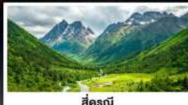
สี่ครุณี