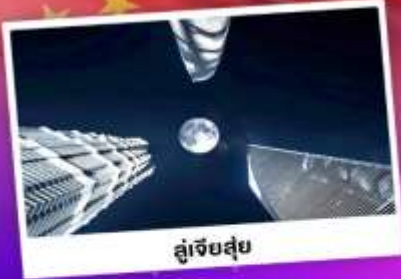
อู่เจียอู่ย