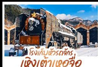
โรงเก็บข้าวกล้อง เจียงเต่าเซอจื่อ