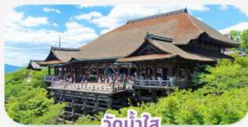
วัดน้ำใส