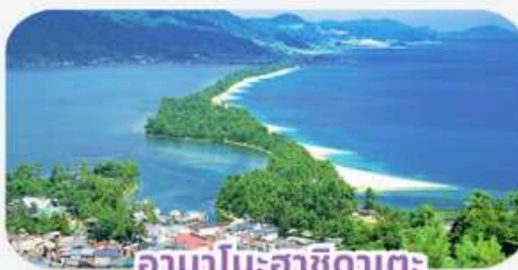
อามาโนะฮาซิดาเตะ