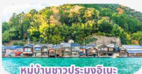
หมู่บ้านชาวประมงอินะ