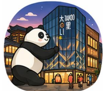
ถนนคนเดินไท่กู่หลี่ (Taikoo Li)

จากนั้นอิสระท่าน ถนนคนเดินชุนซีลู่ ย่านช้อปปิ้งชื่อดังและคึกคักที่สุดของเฉิงตู เต็มไปด้วยห้างสรรพสินค้า ร้านแบรนด์ดัง ร้านอาหาร และสตรีทฟู้ด เหมาะสำหรับช้อปปิ้งและสัมผัสวิถีชีวิตคนเมือง และ ถนนคนเดินไท่กู่หลี่ แหล่งช้อปปิ้งไลฟ์สไตล์สุดทันสมัย ผสมผสานสถาปัตยกรรมจีนโบราณกับดีไซน์โมเดิร์นอย่างลงตัว รายล้อมด้วยร้านค้าแบรนด์ดัง คาเฟ่ และมุมถ่ายรูปสวยๆ มากมาย