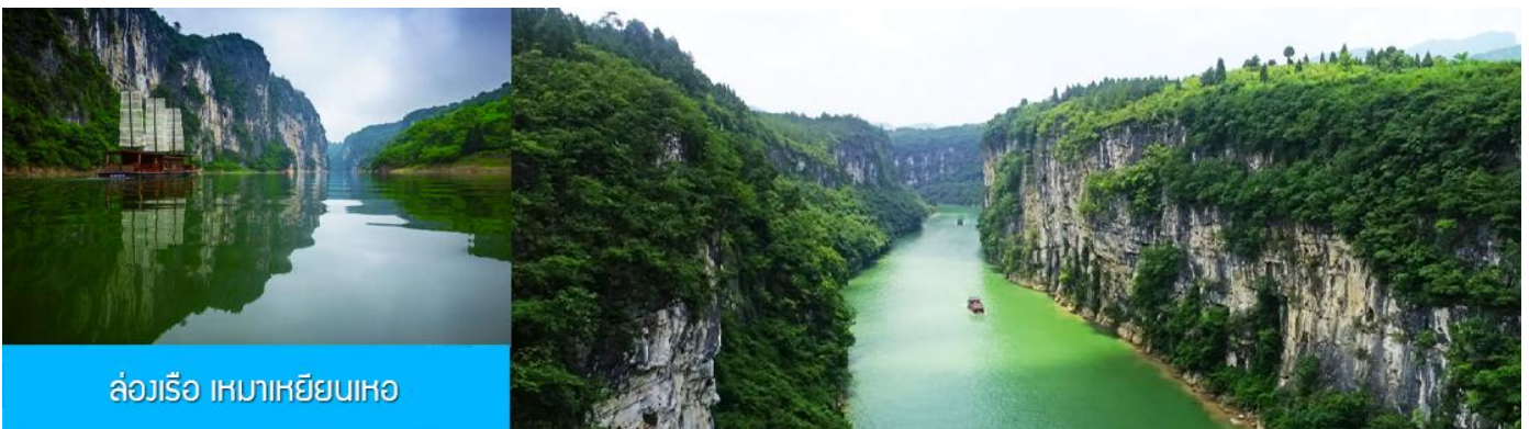
ล่องเรือ เหมาเหยียนเหอ