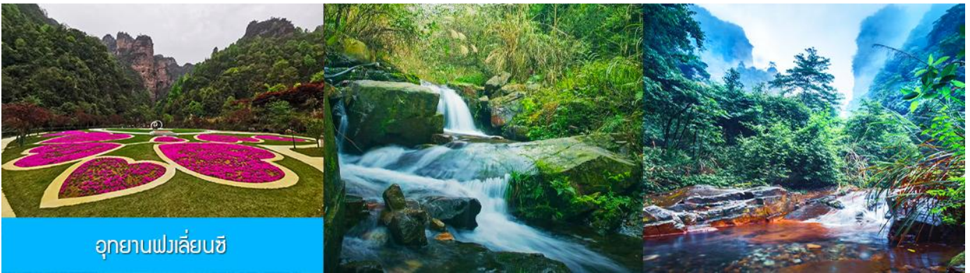
อุทยานฟงเลียนซี