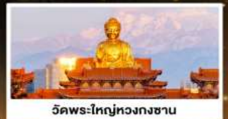
วัดพระใหญ่ทวงกงซาน