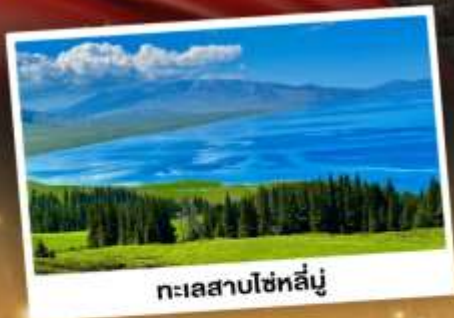
ทะเลสาบไซท์สีมู่

ชมวิวดอกคังการแบบยุโรปผสมเอเชีย กุ้งหน्यानียาวดำ ทะเลสาบสีเทอร์ควอยซ์