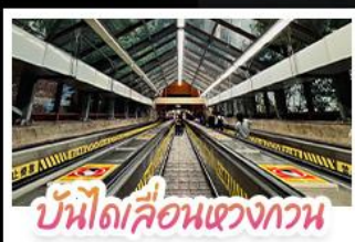
บันไดเลื่อนแขวงกาน