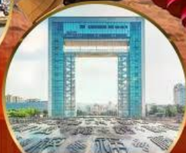
ประตูแห่งความสุข