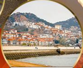
ซาจี้โข่ว